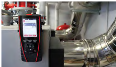
Mesure des conditions climatiques

AMI 310 SK : portable livré avec un module de pression ±500 Pa, une sonde fil chaud télescopique à col de cygne, un tube de Pitot, 2 x 1 m de tube silicone noir et blanc, un embout inox