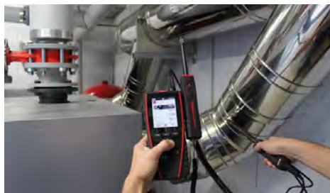
Mesure d'hygrométrie et de vitesse