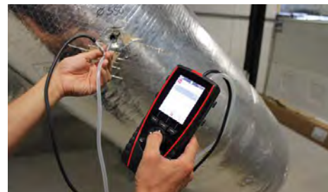
Mesure de pression

Les nouvelles sondes utilisent un câble mini-DIN unique et débrochable qui s'adapte sur toutes les sondes. Chaque appareil est livré avec 2 câbles de ce type. Tous les appareils sont livrés dans leur valise de transport avec leur certificat d'étalonnage, un chargeur et un câble USB.